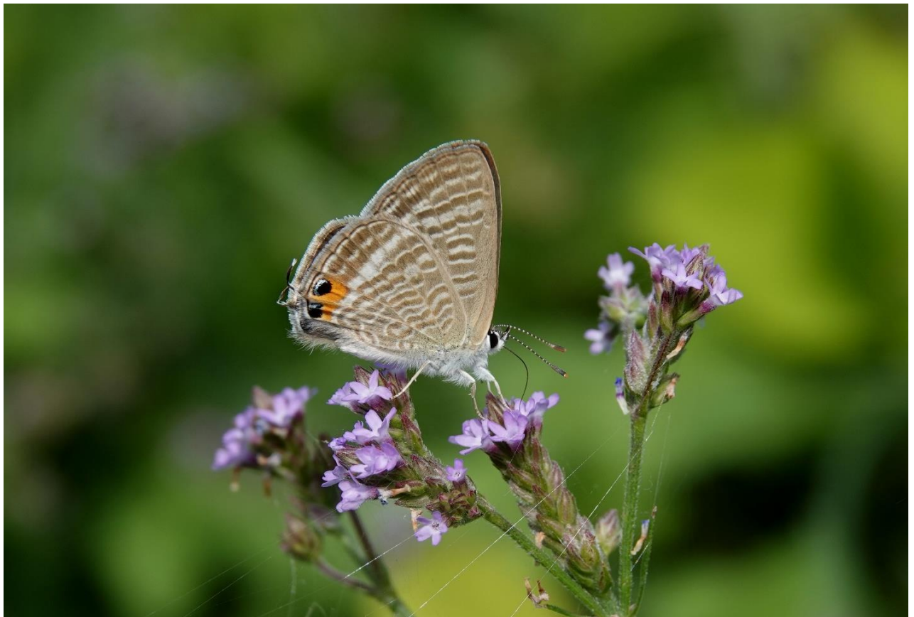
多摩川土手 稲田堤 9月下旬 アレチハナガサで吸蜜