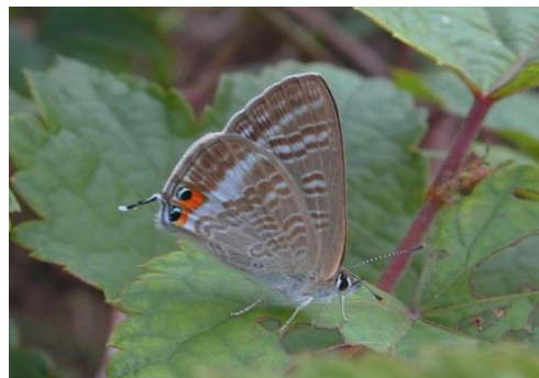
多摩川土手 中野島 10月中旬 後羽尾状突起周辺の橙・黒の紋に金緑青色

多摩川土手にクズの花が咲き出す頃に現れますが移動性が高く、発生を繰り返しながらどんどん北上してついには北海道にまで達し、越冬できず死滅するという奇妙な行動を繰り返しています。越冬できるのは関東地方南部沿岸以南の温暖な地域に限られるようです。マメ科植物の花、蕾などに産卵し、ハイム周辺では生田緑地も含めてクズの開花に前後して現れそれ以前の発生は見たことがありません。個体数が多く互いにしつこく追いかけるので、じっとまることが少なく観察にも撮影にも苦勞するシジミチョウです。