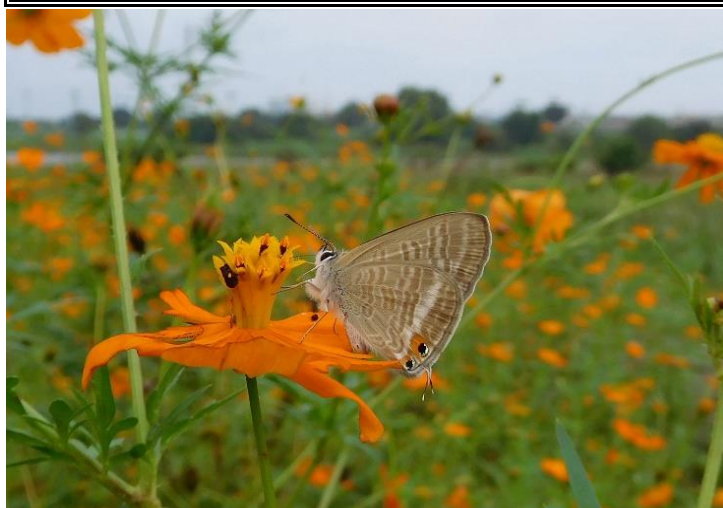
多摩川土手 中野島 9月下旬 キバナコスモス