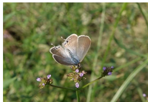
多摩川土手 中野島 10月上旬♀ アレチハナガサ