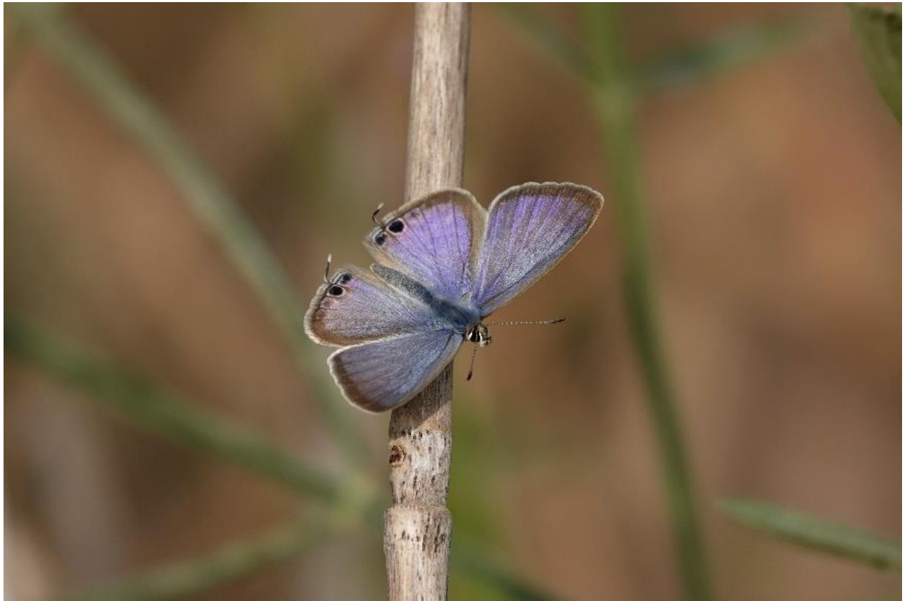
多摩川土手中野島 10月上旬♂